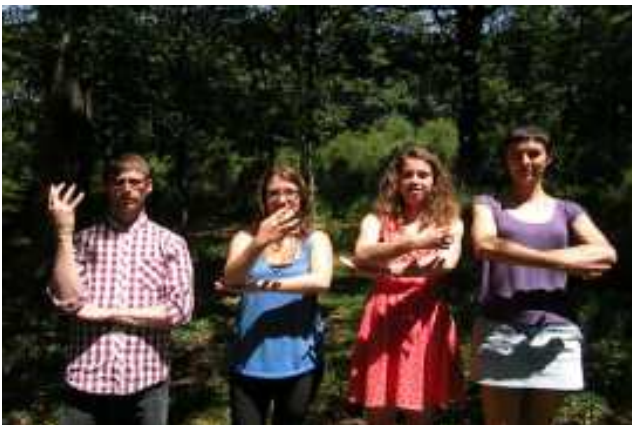
Équipe des Tombées de la Nuit

3-Photos des signes avec les artistes de 10 Doigts Compagnie