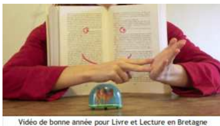
Vidéo de bonne année pour Livre et Lecture en Bretagne

10 Doigts Compagnie se chargera du suivi ainsi cette vidéo sera évidemment diffusée dans notre large réseau « pi » sourd (mail, facebook,...).